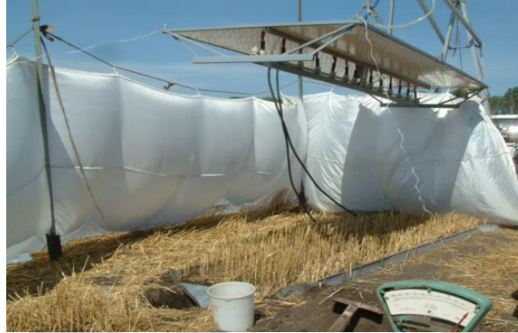
Иллюстрация 2. Экспериментальное оборудование для симуляции искусственного дождя в полевых условиях.

направлены на детальное изучение воздействия осадков на динамику воды, почвы и химических веществ в различных агроэкосистемах[2, 7].