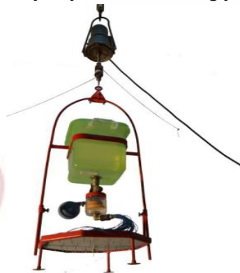
Иллюстрация 3. Переносное аппаратное средство для симуляции дождя в полевых лабораторных условиях.

Переносное устройство для имитации дождя, предназначенное для использования в полевых лабораториях (иллюстрация 3), разработано для изучения влагопоглощающих свойств почвы в разнообразных агроэкологических контекстах и эффективности удаления химических элементов из почвенного слоя поверхностным потоком. Генераторы дождя в данном оборудовании размещены в форме окружности Архимеда. Автоматизированное вибрационное устройство, вращающее почвенный агрегат, обеспечивает равномерное распределение дождевых капель по всей поверхности потока, предотвращая образование углублений в структуре почвы [2].