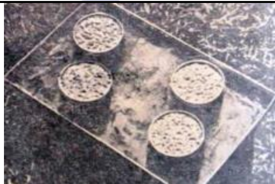
Иллюстрация 5. Блюда Эллисона.

Ниже представлены типы стандартных лабораторных сооружений, используемых для изучения процессов эрозии почв в Индии, США и Китае (иллюстрация 6). Систематическое наблюдение за поверхностным вымыванием частиц почвы при различных конфигурациях лабораторных решеток позволило осуществить анализ эффектов, связанных с инфильтрацией, воздействием растений на процессы удаления частиц почвы и питательных веществ. Также были изучены разнообразные комбинации моделей рельефа, предоставляющие возможность проведения изменений [9].