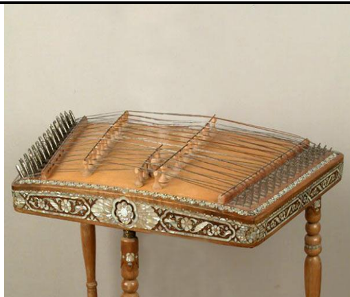
Chang (42 ta metal torlardan iborat cholg'u)