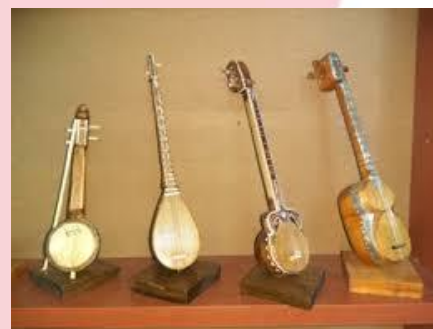
Dutor – (du – ikki, tor – tor(sim)) – ikki simli