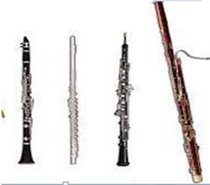
Klarnet Fleyta Goboy Fagot