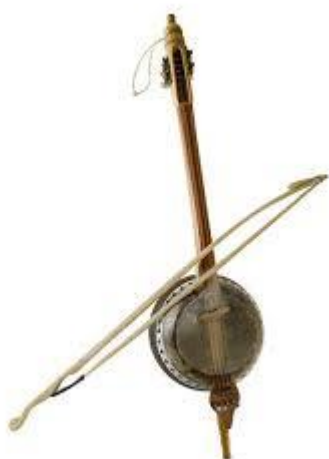
G'idjak (to'rtta simli)