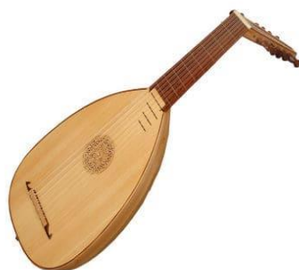
Torli-chertib chalinadigan cholg'ular