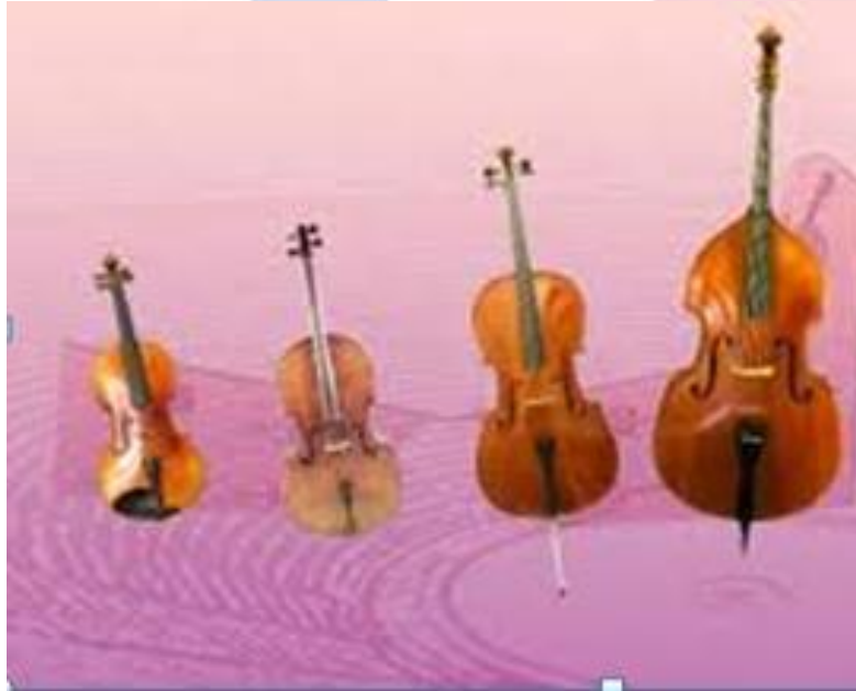
Skripka alt Violonchel contrabas