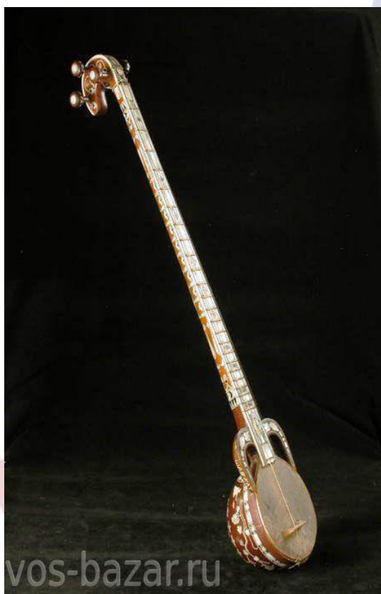
Rubob - 5 ta tordan iborat