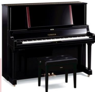
Organ – “cholg'ular qiroli”

Har xil tembrli trubalar yordamida jaranglaydigan eng yirik, eng ulug'vor cholg'u asbobi. Organda chalish qo'llar uchun bir nechta klaviaturalar (manuallar) va oyoqlar uchun pedal klaviaturasi yordamida amalga oshiriladi. Hozirgi vaqtda organda 1 dan 7 tagacha klaviatura (manuallar) mavjud. Organlarda ular biri birining ustki qismida joylashgan. Ulardan tashqari, pastki tovushlar uchun pedalli oyoq klaviatura (5 dan 32 gacha) ham mavjud. Qo'l partiyasi ikkita nota ustunlariga yoziladi. Pedallar partiyasi esa ko'pincha alohida nota chizig'ida yoziladi.