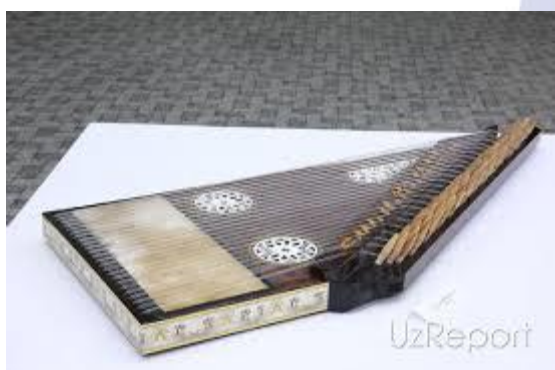
Qonun (24-26 uchtalik toelardan iborat)