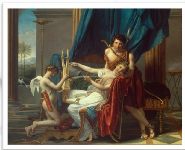
3-rasm. Jakues Luis David. Safo va Faon asari.