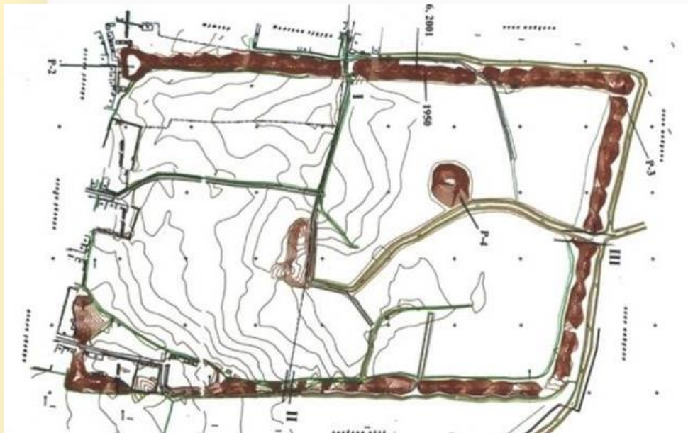
1-расм. Мингтепа археологик ёдгорлиги бош тархи ҳудуди

ёдгорлик ташқи шаҳар билан қўшиб ҳисоблаганда 270 гектардан зиёдлиги маълум бўлди (1-расм). Мингтепа археология ёдгорлиги бош тарх режаси самодан қараганда тўғри бурчакли кўринишга эга, шаҳарнинг икки қатор маҳобатли муҳофаа иншоотлари ўзига ҳослиги билан ажралиб туради.