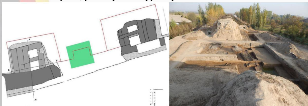
2-расм. Мингтепа археологик ёдгорлиги деворининг асосий кириш буржлари

Ўтган асрнинг 50-йилларда олинган бош тарх режасида арк, ички ва ташқи шаҳар аниқ кўринади. Бизгача ички шаҳар деярли тўлиқ сақланган муҳофаа деворлари билан етиб келган. Шаҳарнинг ғарбий ва шарқий деворларида – 20 тадан, шимолий деворида 12 та, жанубий деворда – 6 та буржлар ўрни яққол кўзга ташланади (2-расм). Ички шаҳарга кириш уч ёки тўрт томонлама кириш қисмидан иборат бўлиб, асосий дарвоза эса ғарбий муҳофаа девори томонида 10 - ва 11 буржлар орасида жойлашган. Ички шаҳар ҳудудида 1946-1947 йиллари 16 та тепалик бўлиб, жануби-шарқий бўлакда қурилиш қолдиқлари кўпроқ сақланган. Шимоли-ғарбий бўлакда, яъни ёдгорлик марказида алоҳида катта тепалик сақланган бўлиб, у шаҳар бошқаруви арк ҳисобланади.